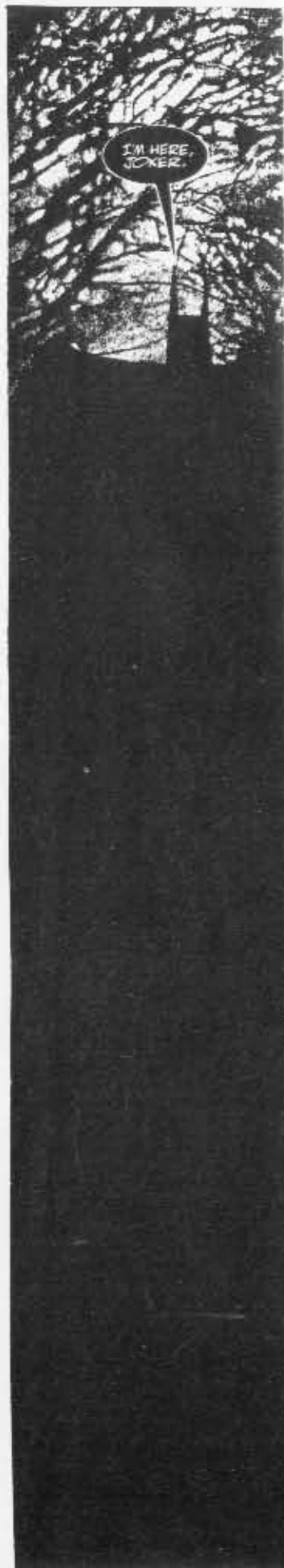
Dave McKean – Arkham Asylum

Aivan vuosikymmenen lopun ilmiö oli englantilaisten tekijöiden voimakas esiinmarssi. Mooren ja Bollandin ohella huomiota saivat esim. sellaiset piirtäjät ja kirjoittajat kuin Alan Davis & Paul Neary ( Batman, Excalibur ), Grant Morrison & Dave McKean ( Batman: Arkham Asylum ), Neil Gaiman (DC:n Sandman ) ja Jamie Delano (DC:n Hellblazer ). Brit-