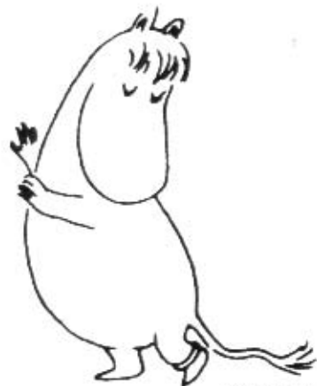
Tove Jansson, Niiskunetti