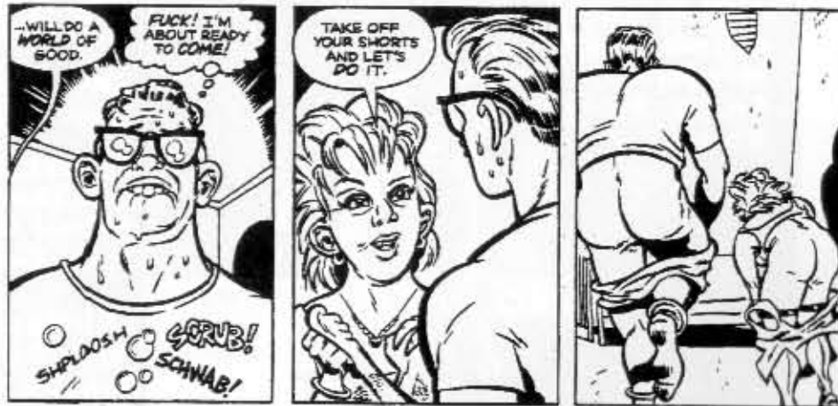
Eichhorn & Fama

Tuntemattomista tekijöistä pistää silmään ni-