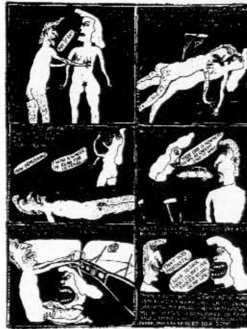
Eichhorn & Moisewitsch

Monet Eichhornin työt käsittelevät seksiä, mutta kokonaan sukupuoliasioihin panostavan kakkoslehden Real Smutlin perustaminen oli yl-