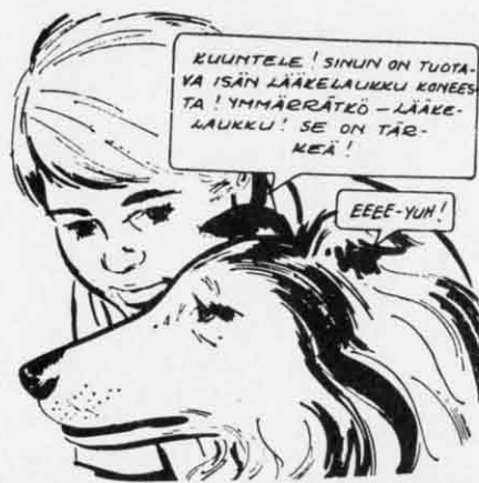
Lassie käväisi Pohjois-Nigeriassa 1963.