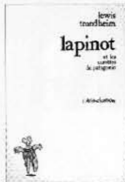
Lapinot et les carottes de Patagonie, joka löytyy Lewisin pöytälaatikosta.

Lisäksi Menu on toiminnut sarjakuvakriittikkona, värittäjänä, graafikkona sekä opettanut sarjakuvaa yliopistossa.