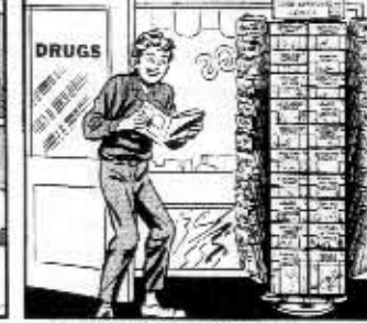
THE PLATES ARE SENT TO THE PRINTER. THE PRINTED COMICS MAGAZINES ARE THEN DISTRIBUTED TO YOUR LOCAL NEWSDEALER.

toja ja kannibalismia - joskin niiden vanhoja numeroita voi vieläkin saada 'tiskin alta' joistakin kioskeista. Muullakin tavalla on asioiden tilaa kohennettu: alastomat on vaateetettu, pistooli ei enää ole kädessä, vaan kotlossaan, kauhukuvat ja sadismi ovat hävinneet. Mutta väkivaltaa esiintyy sarjakuvalehdissä jatkuvasti.