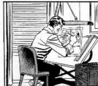
THE SCRIPT IS ILLUSTRATED IN PENCIL BY AN ARTIST WHO WORKS AT TWICE THE SIZE OF A PRINTED PAGE.