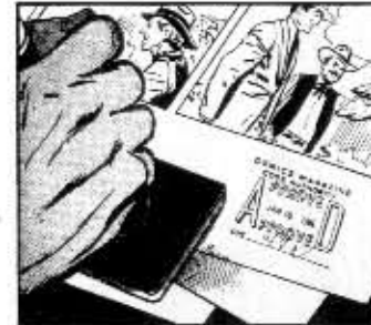
THE FINISHED STORY IS THEN PROOF-READ AND SENT TO THE COMICS CODE AUTHORITY FOR REVIEW AND APPROVAL.