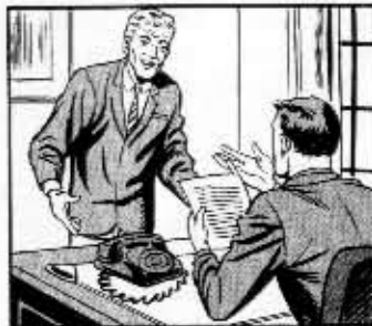
THE EDITOR AND SCRIPT WRITER CONFER TO "BRAINSTORM" IDEAS. THEN THE WRITER CREATES A SCRIPT.