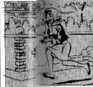
THIS PENCIL DRAWING REQUIRES THE ENGRAVER'S ATTENTION.