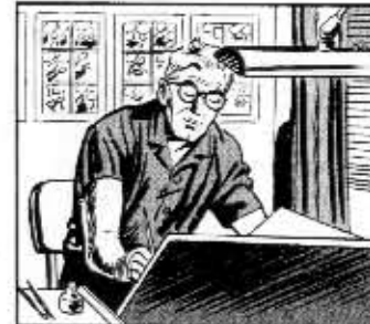
NEXT THE PENCILING IS NEATLY INKED WITH A BRUSH AND THE COPY LETTERED IN WITH A PEN.