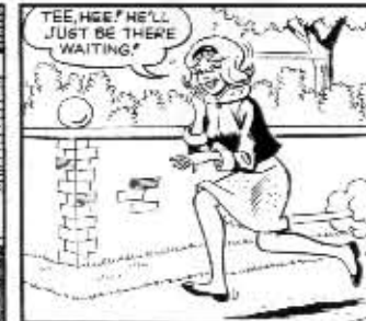
THIS SHOWS THE PANEL INKED IN COMPLETELY AND THE PENCIL LINES ERASED.