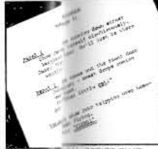
THIS IS A TYPICAL SCRIPT THAT DESCRIBES A PANEL WITHIN THE COMICS STORY.