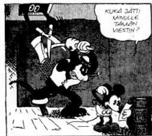
Jopi Mikkiä listimässä