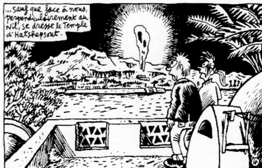
J.C. Menu ja Zab.

Bastian sarjakuvafestivaalit järjestetään huhtikuun ensimmäisenä viikonloppuna. Yhteystiedot: BD à Bastia, Centre Culturel "Una Volta", Rue César-Campinchi, F-20200 Bastia, Ranska.